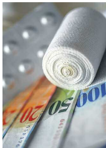
Parto a domicilio tre volte meno caro

notte e nel weekend. Una scelta più redditizia! Non è la filosofia dell'ostetricia al San Giovanni: «Gestire le paure delle donne è nostro compito: illustriamo le possibilità di analgesia, organizziamo colloqui con le levatrici. Spieghiamo i rischi del cesareo per madre (è sempre un'operazione) e bebè (necessitano più spesso di assistenza per problemi respiratori rispetto a chi è nato naturalmente). Anche dopo vari colloqui, alcune donne, con vissuti traumatici, chiedono un cesareo elettivo. Capita di farlo, ma le nostre percentuali sono contenute».