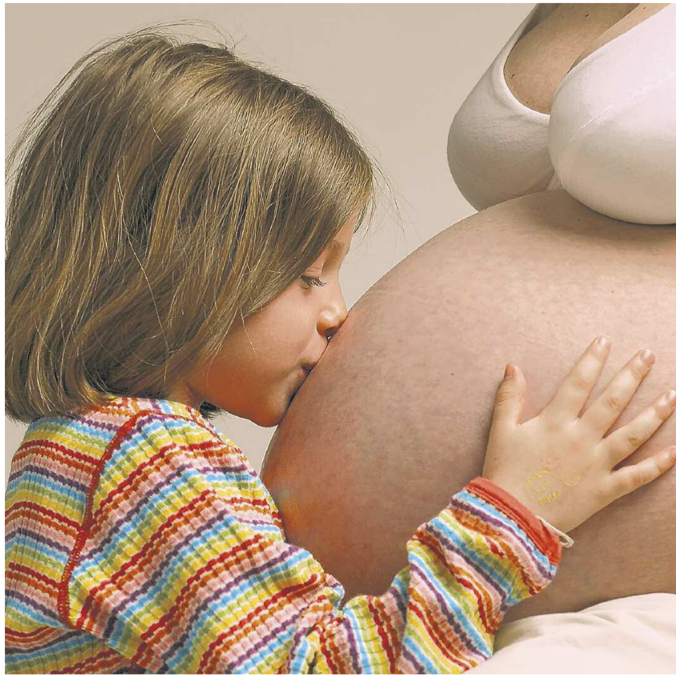
L'età media delle partorienti aumenta e anche i cesarei

Percentuali troppo elevate di parti cesarei per il governo federale che in un rapporto (vedi box) ha messo in evidenza i rischi del ricorso al bisturi, senza motivi medici, per madre (trombosi, embolie ed emorragie) e figlio (problemi respiratori), raccomandando una maggiore informazione alle donne: penalizzate soprattutto quelle che pianificano altri figli. Ricordiamo che l'Organizzazione mondiale della sanità (Oms) fissa una quota tra il 5-10%. Oltre il 15% sarebbe pericoloso: ci sono più rischi che vantaggi. Al riguardo, Monir Islam, direttore del Dipartimento per una gravidanza più sicura dell'Oms, spiega così la differenza fra il tasso di cesarei negli ospedali pubblici e in quelli privati: «Queste operazioni sono programmabili, più brevi rispetto a un travaglio naturale e permettono di ridurre il lavoro di notte e durante il fine settimana. Sono quindi chiaramente più redditizi per gli ospedali privati». Ma si sta facendo anche l'interesse delle partorienti e dei loro figli?