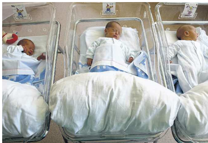
Chi nasce con un cesareo ha più spesso problemi respiratori

parti naturali anche quando le pazienti assolutamente non vogliono (e non sono private del diritto di scelta perché incinte, o sì?), noi abbiamo più ginecologi che su richiesta esplicita delle pazienti praticano tagli cesarei». Ecco la risposta, via e-mail, del Gruppo Genolier, per la clinica Sant'Anna: «Collaboriamo esclusivamente con medici indipendenti, garantiamo ai loro pazienti la privacy e il rispetto della sfera intima. Non comunichiamo nessun dettaglio medico», scrive Séverine Van der Schueren , capo amministrativo della Aeviv Holding Sa.